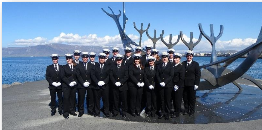
Útskrift úr Fangavarðaskóla 24. maí 2019

Haustið 2018 var hrint úr vör námi skv. námskrá Fangavarðaskólans fyrir tiltekinn hóp starfsmanna Fangelsismálastofnunar sem ekki hafði gefist kostur á að ljúka þessu námi fyrr. Nýbreytnin fólst í því að allt bóklegt nám var sett í rafrænt umhverfi en verklegt nám var áfram kennt í staðnámi. Verkefnið var liður í úrvinnslu bókarar með kjarasamningi SFR og ríkisins frá 2015. Þátttakendur luku allir náminu á fullnægjandi hátt og voru útskrifaðir þann 24. maí árið 2019.